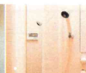
プライベートシャワー