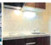
キッチンコーナー